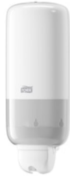
Tork Liquid and Spray Soap Disp. Wh, S1 560000