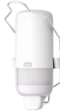
Tork liquid soap disp w bracket, White 560101