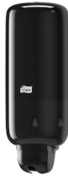
Tork Liquid and Spray Soap Disp. Bl, S1 560008