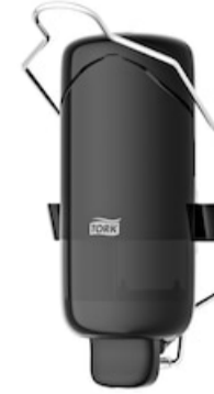
Tork liquid soap disp w bracket, Black 560109