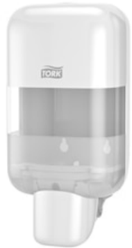
Tork Disp. Sæbe_Hånddes. Mini 565200