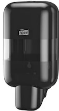
Tork Disp. Sæbe og Hånddes. Mini 565208